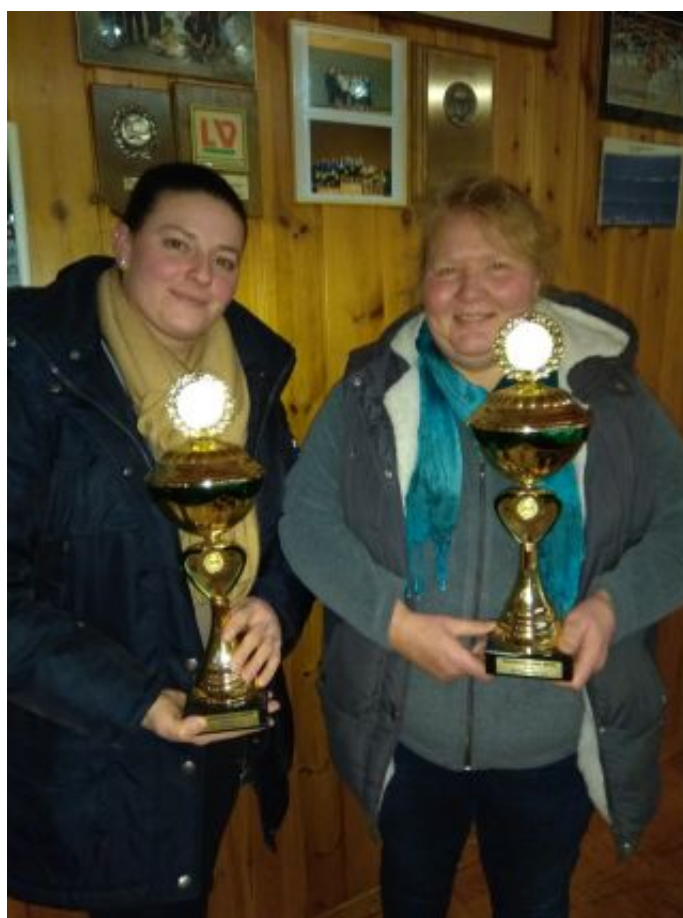
Vereinsmeister Ponys und Vereinsmeister Ü50

Ausserdem erfolgte die Ehrung der Vereinsmeister 2019